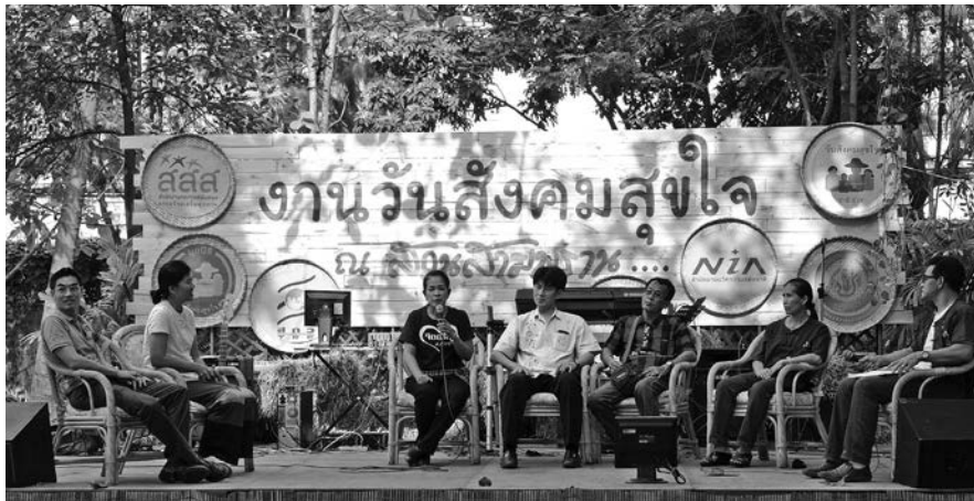
เป็นแหล่งเรียนรู้ด้านเกษตรอินทรีย์ต่อคนในชุมชน และผู้สนใจทั่วไป