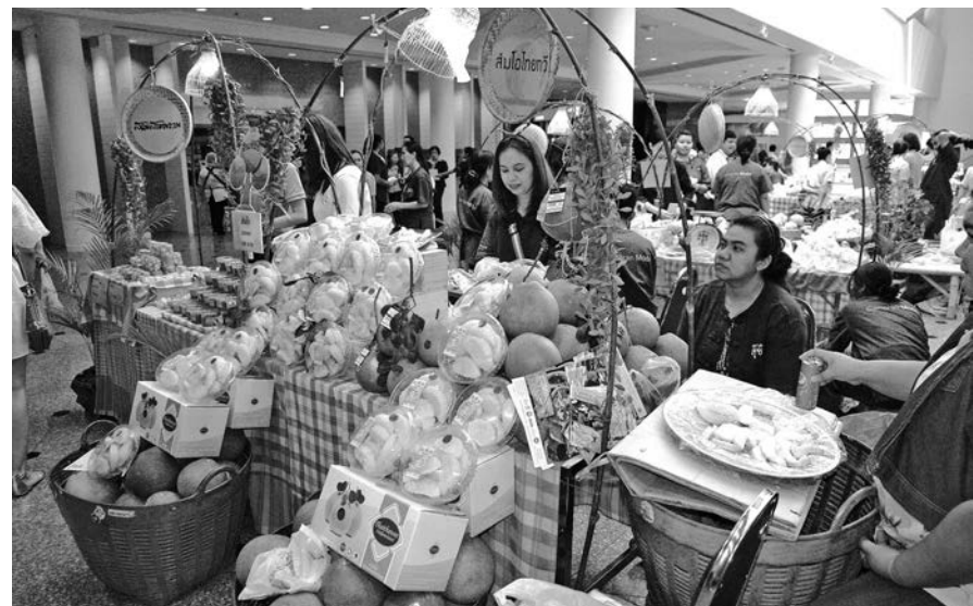
การจัดตลาดสุขใจสัญจร เพื่อเข้าถึงผู้บริโภค ณ SCB Park

ให้กับเกษตรกร การเรียนรู้การปลูกผักอินทรีย์ไว้บริโภคเอง เป็นต้น