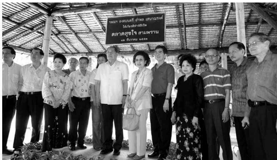
ฯพณฯ องคมนตรี อภาพ เสนาณรงค์ เป็นประธานเปิดตลาดสุขใจ เมื่อวันที่ 12 ธันวาคม 2553

ชุมชนที่เข้าร่วมได้มีการร่วมมือกันในการยกระดับความรู้ ทักษะการผลิตเกษตรปลอดภัยและเกษตรอินทรีย์ การจัดทำแผนธุรกิจร่วมกัน ทำให้เกิดการสร้างระบบธุรกิจสหกรณ์แนวทางใหม่ที่เอื้อประโยชน์แก่ภาคีเครือข่าย โดยมีโรงแรมสามพรานริเวอร์ไซด์เป็นแกนกลางของกลุ่มธุรกิจ ทำให้เกิดกระบวนการเรียนรู้ร่วมกันระหว่างสมาชิกในชุมชน เกิดการช่วยเหลือเกื้อกูลทั้งด้านเศรษฐกิจและสังคม สามารถรักษาหรือปรับปรุงสภาพแวดล้อมให้เหมาะสมกับระบบนิเวศ โดย