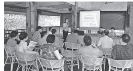
การจัดเวทีสร้างความเข้าใจเรื่องการรวมกลุ่มและเกษตรกรอินทรีย์