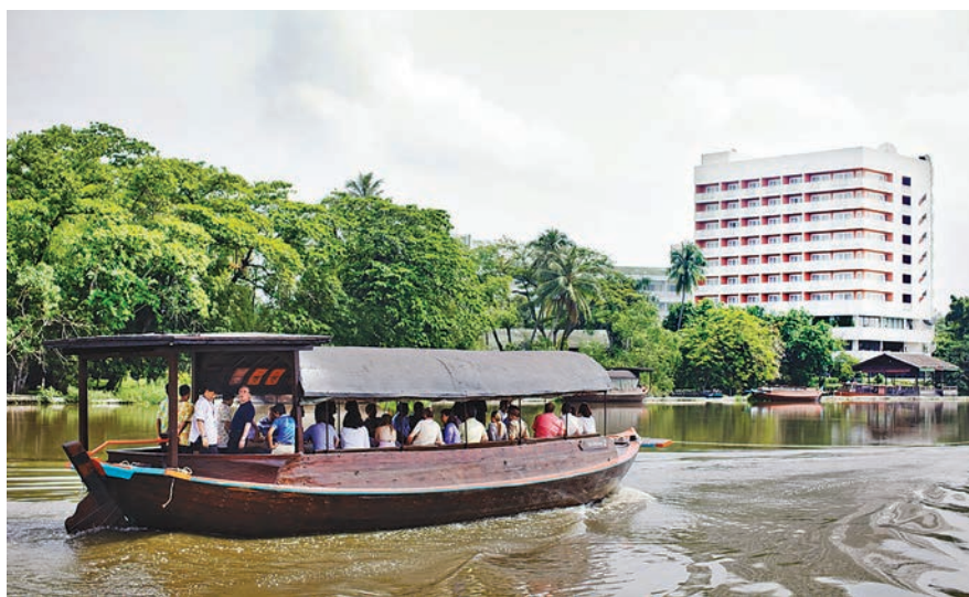
โรงแรมสามพรานริเวอร์ไซด์

โครงการกลุ่มธุรกิจเชิงคุณค่าสามพราน เป็นการทดลองนำภาคธุรกิจ คือ โรงแรมสามพรานริเวอร์ไซด์ เข้ามาร่วมงานกับชุมชน คือ เครือข่ายเกษตรกรในจังหวัดนครปฐม เพื่อหาแนวทางในการยกระดับคุณภาพการผลิตสินค้าเกษตรสู่สินค้าปลอดภัยและสินค้าเกษตรอินทรีย์ ภายใต้การดำเนินงานในรูปของกลุ่มธุรกิจ มีการศึกษาวิจัย 3 ระยะ คือ สร้างความเข้าใจ สร้างแนวความคิดการพึ่งพาและร่วมมือ และศึกษาแนวทางการจัดการโซ่อุปทานเกษตรกรปลอดภัยและเกษตรอินทรีย์ที่สามารถเชื่อมโยงระหว่างการผลิตและการตลาดอย่างยั่งยืน ทำให้เกิดภาคีพันธมิตรเข้ามามีส่วนร่วมกับกลุ่มธุรกิจในรูปกลุ่มธุรกิจสหกรณ์เชิงคุณค่าสามพรานซึ่งมีปณิธานเดียวกัน โดยกลุ่มได้พัฒนาตัวแบบการดำเนินงานใน