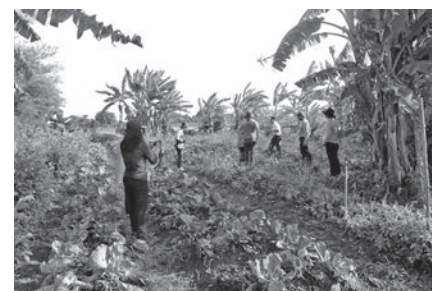
เป็นศูนย์เรียนรู้มีชีวิตด้านเกษตรอินทรีย์

ผลการวิจัยทำให้ได้ชุดความรู้ด้านการจัดการตลาดชุมชน มีการพัฒนาระบบและรับรองมาตรฐานเกษตรปลอดภัยและมาตรฐานเกษตรอินทรีย์ร่วมกับภาคี เพื่อยกระดับเกษตรกรในการผลิตสินค้าที่ได้รับการรับรองคุณภาพมาตรฐานสินค้าเกษตรอินทรีย์เพิ่มมากขึ้น รวมทั้งได้พัฒนาแนวคิด “สามพรานโมเดล” เป็นรูปแบบการพัฒนาธุรกิจร่วมกับชุมชน และได้นำมาใช้ในการดำเนินงาน