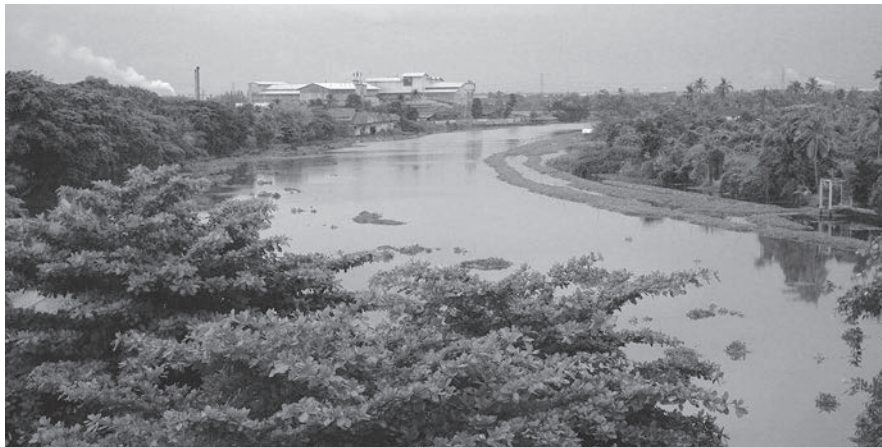
โรงแรมอุตสาหกรรมในอำเภอสามพราน

ชุมชนสามพราน จังหวัดนครปฐม ได้รับผลกระทบจากปัญหาภาวะสิ่งแวดล้อมอันเนื่องมาจากการใช้สารเคมีในการทำการเกษตรและการปล่อยน้ำเสียของโรงงานอุตสาหกรรมลงแม่น้ำท่าจีน ก่อให้เกิดผลกระทบต่อสุขภาพของประชาชนและการดำรงชีวิต ในปี พ.ศ.2552 ได้มีการจัดเวทีลานเสวนาระหว่างแกนนำชุมชน นักวิชาการจากมหาวิทยาลัย เกษตรศาสตร์ และโรงแรมสามพรานริเวอร์ไซด์ เพื่อเป็นแนวทางในการพัฒนาอาชีพและชีวิตความเป็นอยู่ของคนในชุมชน นักวิชาการจากมหาวิทยาลัยเกษตรศาสตร์ และโรงแรมสามพรานริเวอร์ไซด์ เพื่อเป็นแนวทางในการพัฒนาอาชีพและชีวิตความเป็นอยู่ของคนในชุมชน ได้ข้อสรุปคิดเห็นตรงกันว่า ควรใช้การร่วมกลุ่มเพื่อการพึ่งพาและร่วมมือกันแก้ปัญหาวิกฤติสิ่งแวดล้อมและยกระดับความเป็นอยู่ของชาวสามพรานได้อย่างยั่งยืน จึงได้รวมตัวกันในรูป “กลุ่มธุรกิจเชิงคุณค่าสามพราน” มีโรงแรมสามพรานริเวอร์ไซด์เป็นแกนนำ และได้กำหนดปณิธานร่วมกันว่า “ภาคีทุกคนต้องเข้าใจและเข้าถึงเกษตรกรอินทรีย์ โดยมีสวนสามพรานเป็นเสาหลัก ในการให้ความรู้และปัญญาไปสู่ความกินดีอยู่ดี มีความสุขถ้วนหน้า”